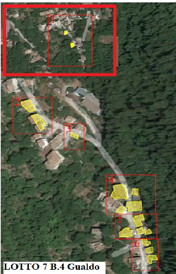
LOTTO 7 B.4 Gualdo